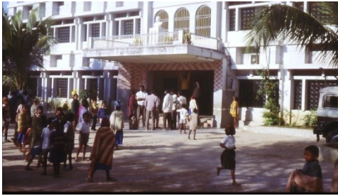
Monigram: Schule und Kinderheim

„Wenn wir nicht eine Welt aufbauen können, in der Kinder nicht mehr leiden, können wir wenigstens versuchen, das Maß der Leiden der Kinder zu verringern“